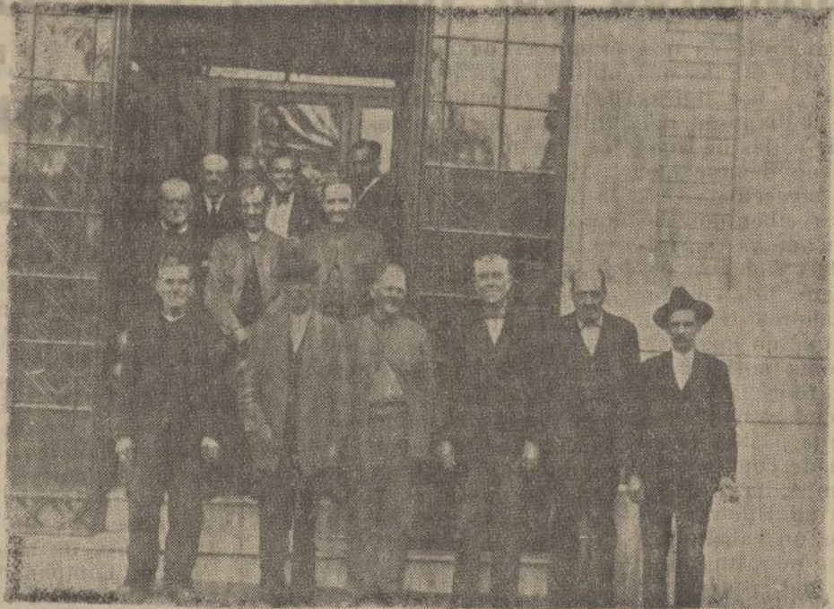
Grupo de obreros que hasta el número de 22 recibieron 400 ptas. cada uno, el pasado día 30 de Mayo