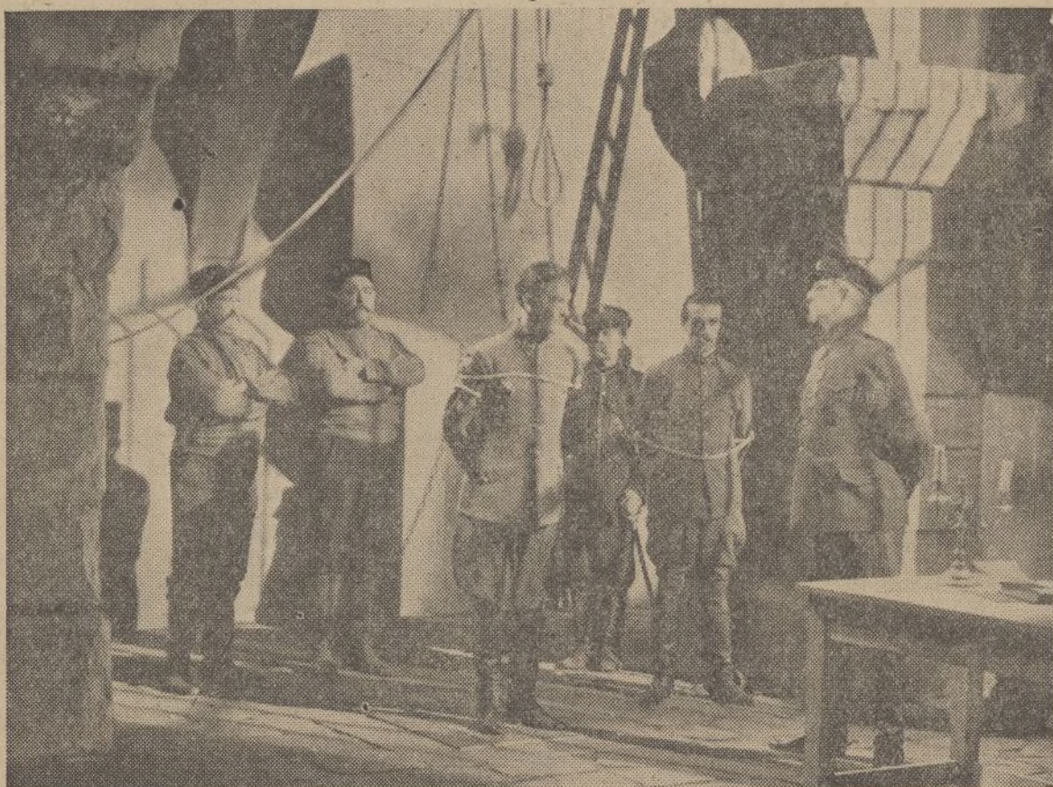
Una emocionante escena de la producción francesa «FEDORA», que distribuye Cifesa en esta temporada