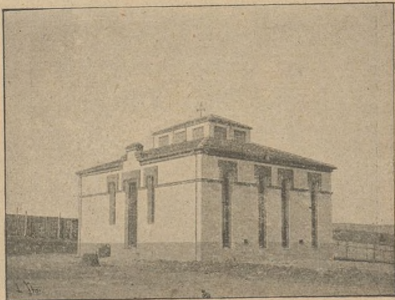
FIG. E. — Pabellón de infecciosos.

D. Detrás, y en el centro de los anteriores, y de ellos separado por espacio de varios metros, se alza el pabellón de consultorios ó dispensarios, grande, hermoso, en cuyos diferentes pisos hay dispuestos servicios importantes. En el subsuelo, bien ventilado y alumbrado, las cocinas donde se guisa á vapor, el generador de esta fuerza, los almacenes, despensas, comedor común, lavaderos y planchaderos mecánicos. En el piso superior á éste, que corresponde á la planta baja, las dos grandes salas de espera de los enfermos, y el servicio aislado de escaleras de subida y de bajada, para facilitar el movimiento, por decirlo así, automático de los enfermos. En el piso principal los consultorios á derecha é izquierda de dos grandes pasillos con letreros que expresan sus respectivas especialidades: Huesos y articulaciones. — Electricidad. — Matriz. — Orina. — Ano é intestinos. — Estómago. — Niños. — Cirugía general. — Garganta. — Ojos. — Varios, y en un extremo la sala de conferencias, que sirve á la par de biblioteca.