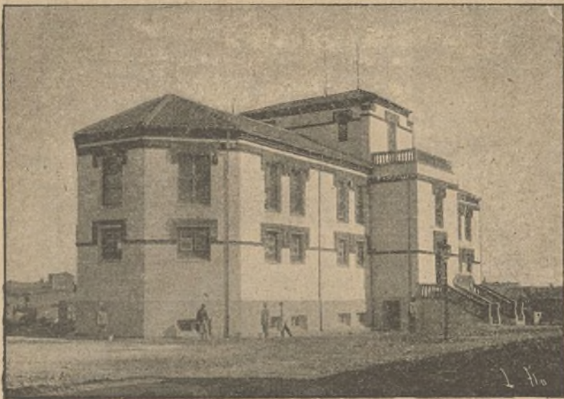
FIG. D. — Pabellón de consultorios.

baño, retrete, útiles de limpieza y habitación de la enfermera con teléfono. En el centro de este cuerpo y situado de modo que puedan verlo los pacientes desde su cama, hay un altar.