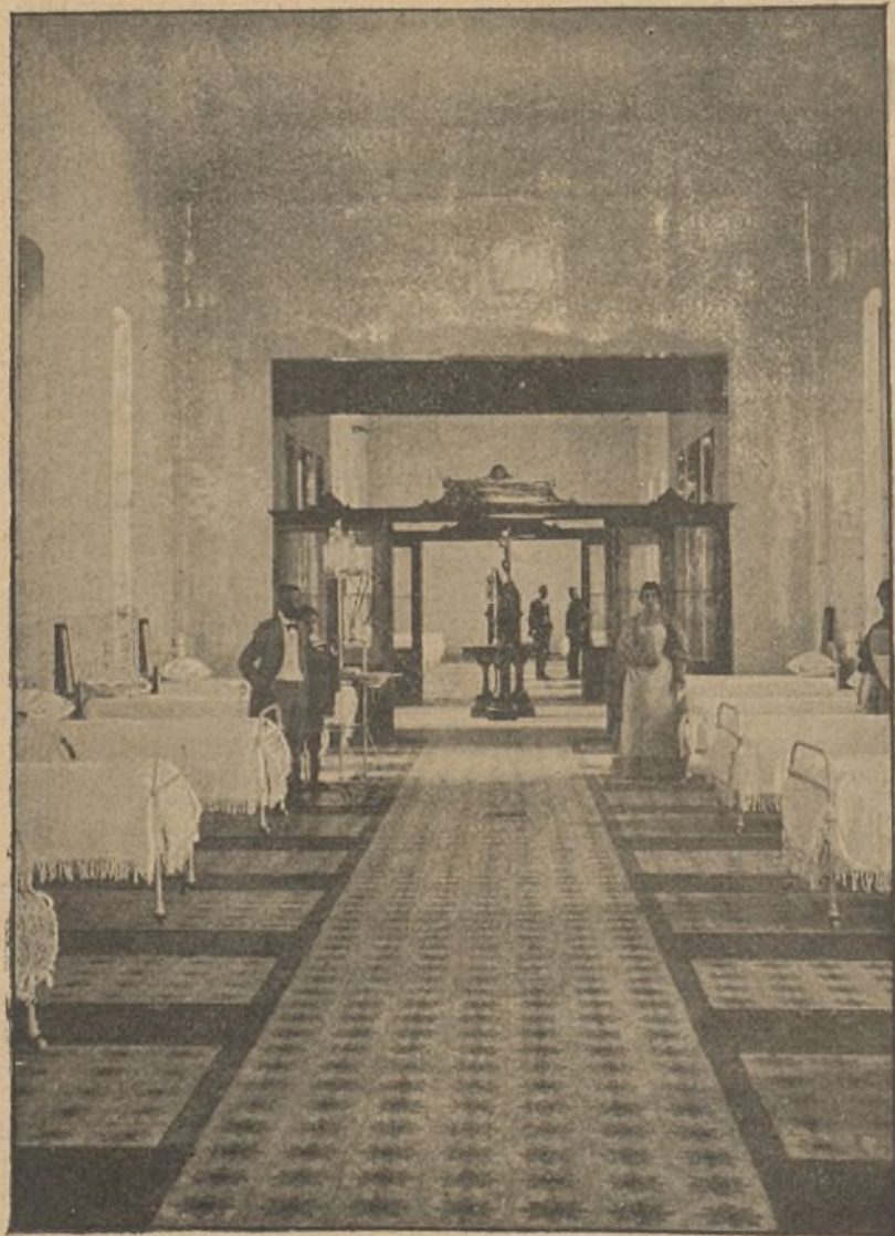
FIG. C. — Interior de una de las enfermerías.

B y C. Dos grandes pabellones, uno á cada lado y en línea algo posterior del pabellón ya citado, y unidos á éste por una galería utilizable como salitas de visita para las familias de los enfermos. Ambos pabellones son las enfermerías, el de la derecha para mujeres y el de la izquierda para hombres. Contienen cada uno