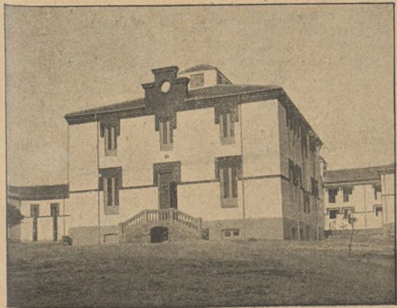
FIG. A. — Pabellón central, de servicios generales.

Consta el Instituto en la actualidad de los siguientes pabellones: