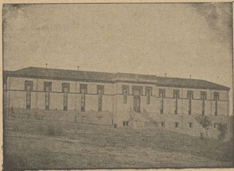
FIG. B. — Pabellón enfermería de mujeres.