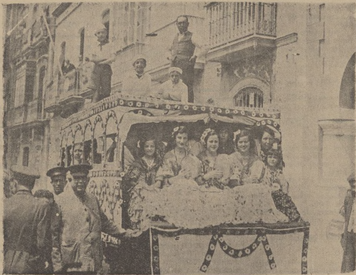
Una de las tantas camionetas adornadas que han acudido, repletas de muchachas, a rendir pleitesía a la Blanca Paloma.

¿Que si son bonitas? Nadie lo duda. Son mujeres de la Vega. Esto es sinónimo de gracia, simpatía y belleza. Si nó, que lo diga el popular «Marinero»