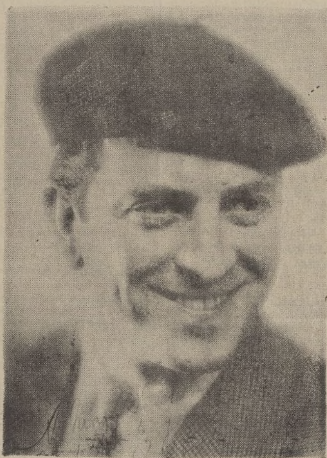
Roberto Rey, uno de los galanes cinematográficos que más se han hecho aplaudir por sus aciertos interpretativos en la pantalla.

—Allí se asegura también eso, porque Greta es la artista más familiar de todas cuando pululan por los estudios