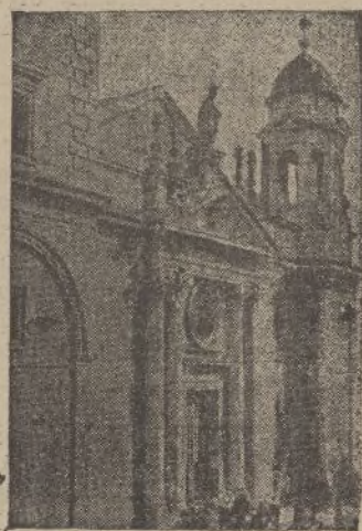
Portada de San Bartolomé