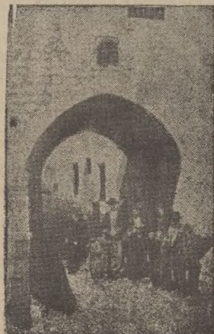
Jaén. Arco de San Lorenzo