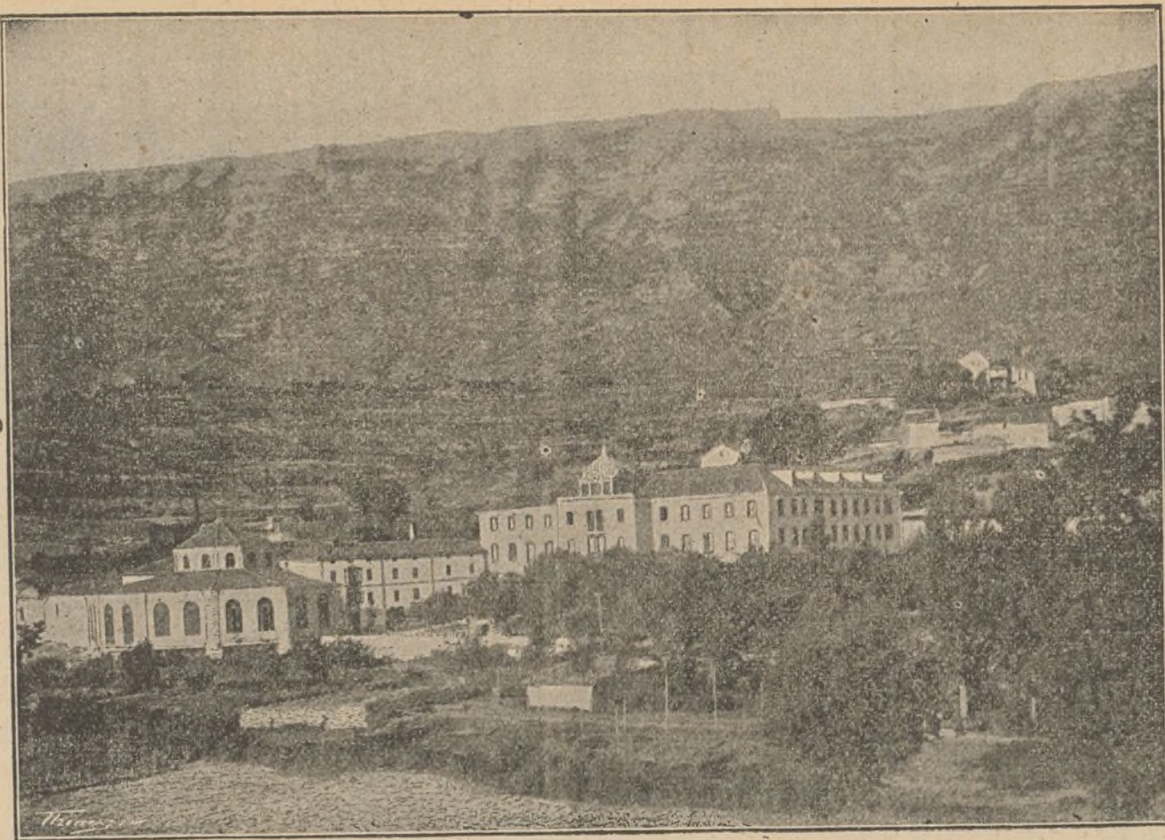
Vista del Balneario de Zuazo (Alava).

El crédito universal que ha alcanzado este importante Establecimiento, es la mejor garantía de las virtudes curativas de estas especiales aguas minerales en todas las enfermedades crónicas del órgano respiratorio , sean ó no diatésicas y cualquiera el lugar de este aparato en que se hallen localizadas. La feliz asociación mineral del sulfuro de sodio al nitrógeno que poseen, llena la doble indicación que el médico se propone en la mayor parte de los enfermos de pecho y garganta que con tanta frecuencia lo necesitan; demostrado palmariamente con los satisfactorios resultados obtenidos en enfermos, y que no consiguieron con ninguna agua mineral dotada tan sólo de uno de estos dos principalísimos factores. La Sociedad propietaria, deseosa de corresponder á la numerosa y selecta concurrencia que acude en busca de su salud, no ha perdonado medio para proporcionarles cuanto aconseja la ciencia médica moderna, montando al efecto un Balneario de nueva planta, dotado de cuanto más útil se conoce en el extranjero para conseguir los mejores resultados. Un millón de pesetas gastado en las nuevas obras demuestran la importancia de las mismas, comprendidas en ellas un suntuoso hotel con fonda de primer orden á la española y francesa para todas las clases de la sociedad; elegantísimo salón de fiestas; café y billares; preciosa Capilla pública; galerías cubiertas para paseo y un gran parque para recreo, iluminándose todos los edificios con profusión de luz eléctrica.