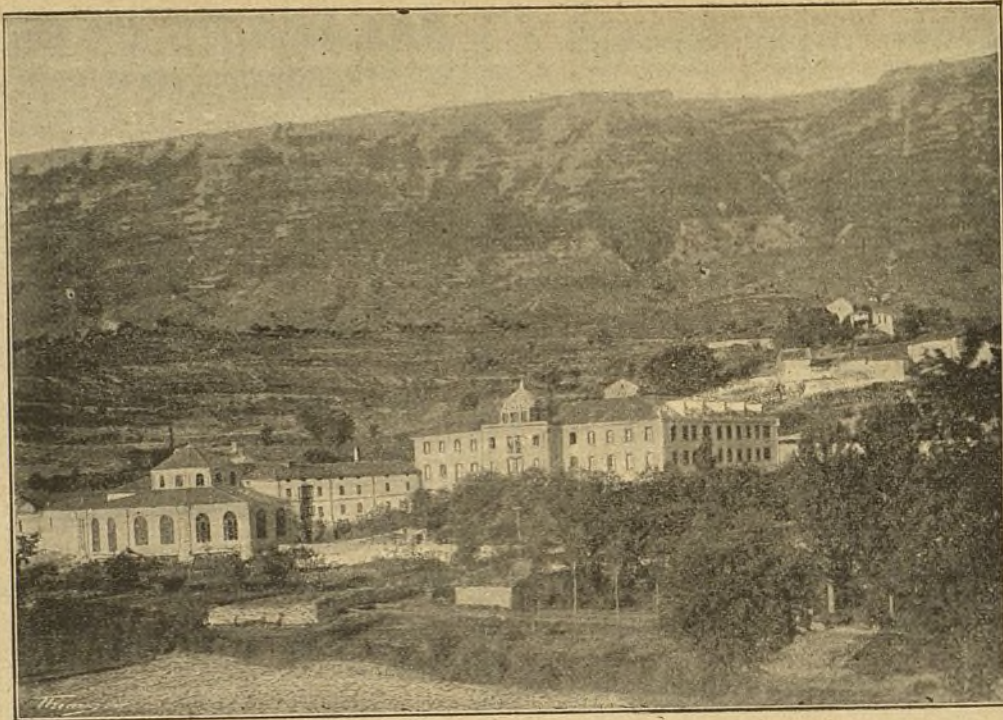
Vista del Balneario de Zuazo (Alava).