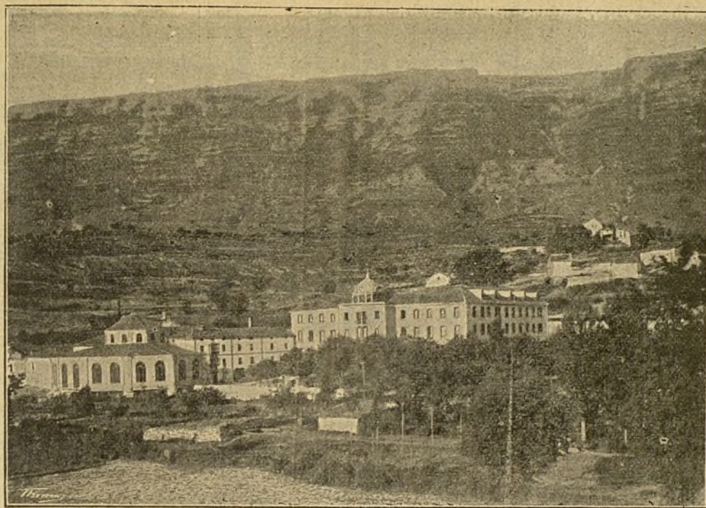
Vista del Balneario de Zuazo (Álava).

El crédito universal que ha alcanzado este importante Establecimiento, es la mejor garantía de las virtudes curativas de estas especiales aguas minerales en todas las enfermedades crónicas del órgano respiratorio , sean ó no diatésicas y cualquiera el lugar de este aparato en que se hallen localizadas. La feliz asociación mineral del sulfuro de sodio al nitrógeno que poseen, llena la doble indicación que el médico se propone en la mayor parte de los enfermos de pecho y garganta que con tanta frecuencia lo necesitan; demostrado palmariamente con los satisfactorios resultados obtenidos en enfermos, y que no consiguieron con ninguna agua mineral dotada tan sólo de uno de estos dos principalísimos factores. La Sociedad propietaria, deseosa de corresponder á la numerosa y selecta concurrencia que acude en busca de su salud, no ha perdonado medio para proporcionarles cuanto aconseja la ciencia médica moderna, montando al efecto un Balneario de nueva planta, dotado de cuanto más útil se conoce en el extranjero para conseguir los mejores resultados. Un millón de pesetas gastado en las nuevas obras demuestran la importancia de las mismas, comprendidas en ellas un suntuoso hotel con fonda de primer orden á la española y francesa para todas las clases de la sociedad; elegantísimo salón de fiestas; café y billares; preciosa Capilla pública; galerías cubiertas para paseo y un gran parque para recreo, iluminándose todos los edificios con profusión de luz eléctrica.