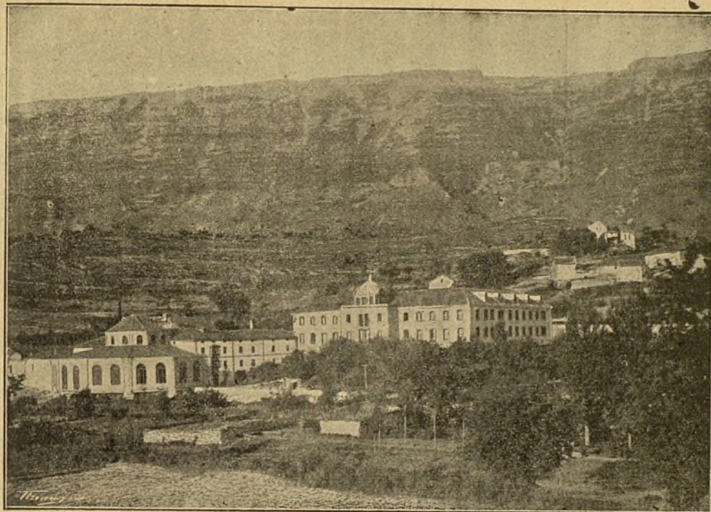
Vista del Balneario de Zuazo (Alava).

Premiadas con cuatro medallas de ORO y tres de PLATA