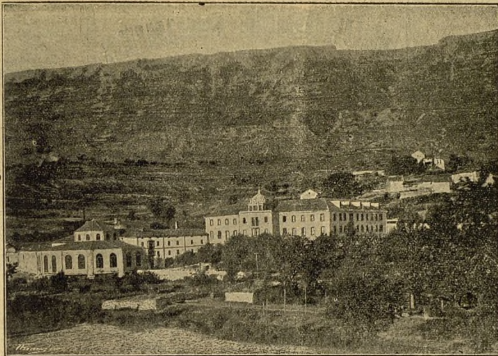
Vista del Balneario de Zuazo (Alava).

Premiadas con cuatro medallas de ORO y tres de PLATA