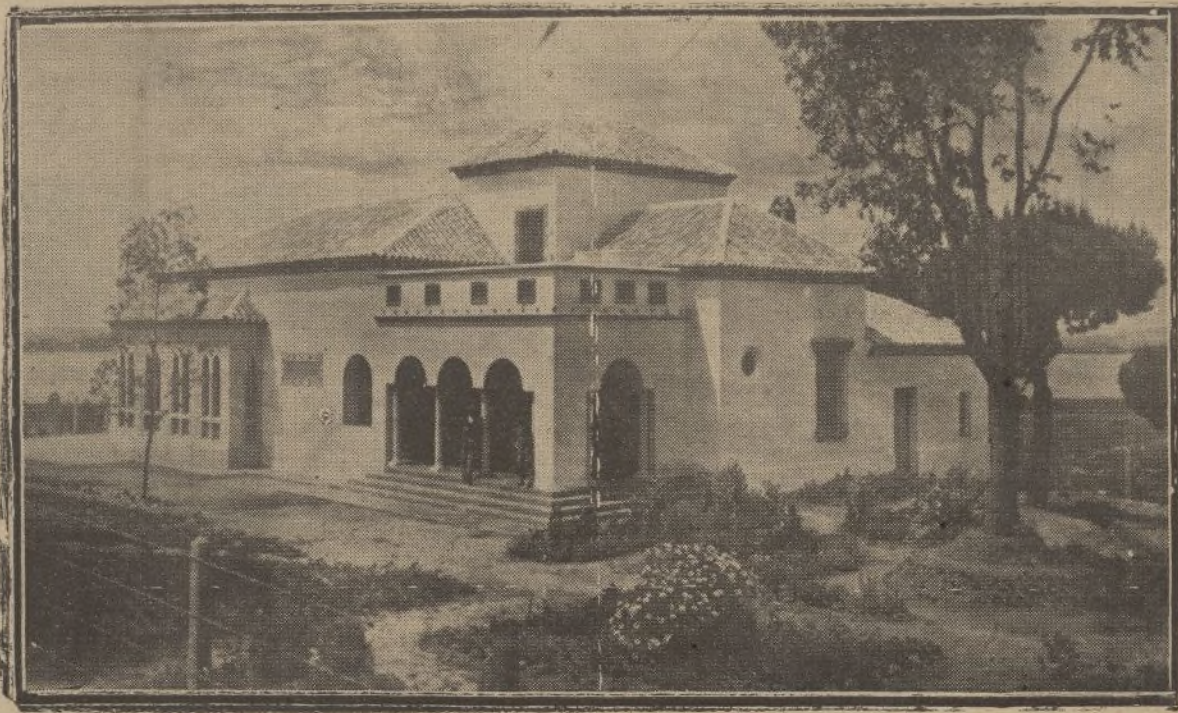
La Hostería de la Rábida, a la que el Gobierno parece que va a sacar de su actual postración e invalidez. Sin esto, el reuma acabaría pronto con ella.

más policromas las flores y toda la Primavera engalanada se arroja al paso de la suntuosa Custodia en la que sobre el dorado viril Jesús bajo la Sagrada Forma se nos muestra. Es el mismo Dios divinamente sintetizado en el Augusto Sacramento del Altar. Es ese Dios que solo con la Fé concebimos porque la razón sin ella vacila, se rinde y pervierte. Es el Dios del Cenáculo que antes de inmolar por nosotros nos legó tan sublime manjar angélico para hacernos eternamente herederos de su Gloria.