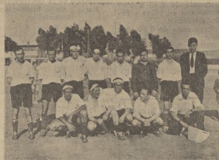
El «Bloque F. C.» que el domingo jugó partido amistoso con el Deportivo Andaluz perdiendo por la mínima diferencia.