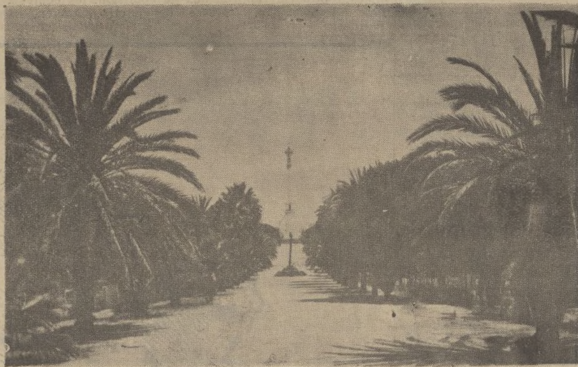
Hermosa avenida que conduce al monumento elevado a la memoria de Colón en La Rábida.