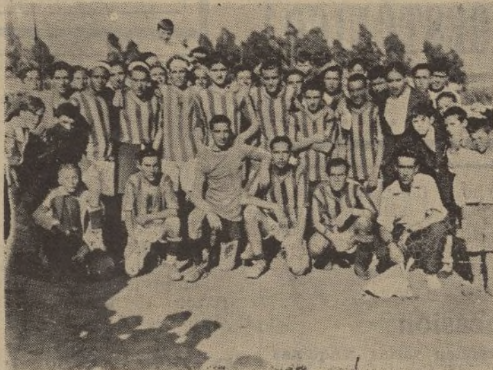
Equipo del Club D. Andaluz que en partido amistoso, venció al «Bloque F. C.» por dos goals a uno

En Marruecos existía un gran mal estar entre los elementos adictos a Abd-el-Krim, a causa de la terrible escasez de municiones y el hambre existente por aquellos poblados.