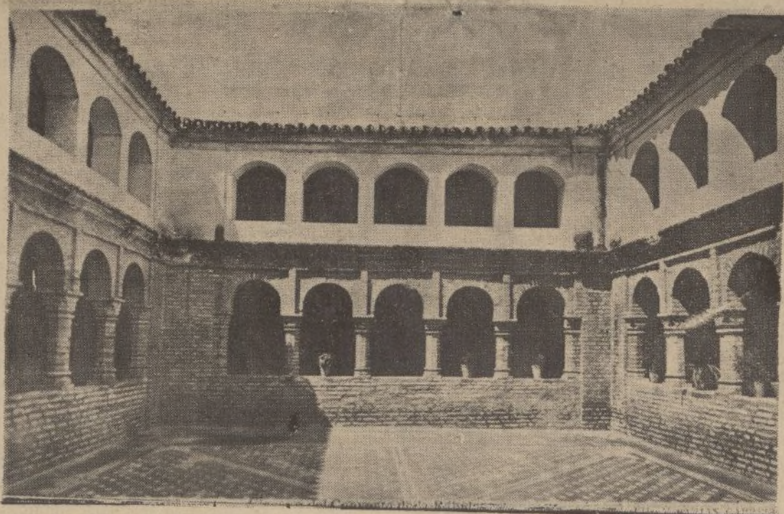
Bellísimo patio mudéjar, captado millares de veces en los kodaks de los turistas que visitan este histórico cenobio.