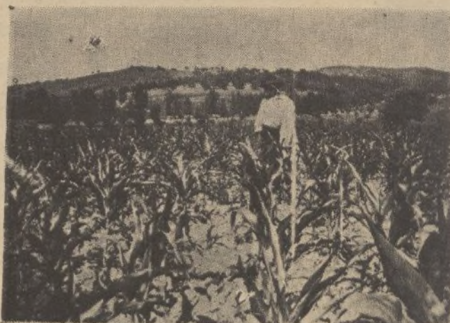
Maíz obtenido en terrenos regados, después de haberse recogido una cosecha de habas gigantes, de la finca «Santa Clara», término de Aroche.