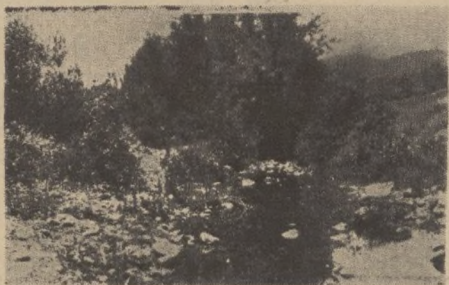
Las aguas que serán recogidas por el pantano La Mezquita son magníficas para riego, como lo demuestra la vegetación de sus márgenes.