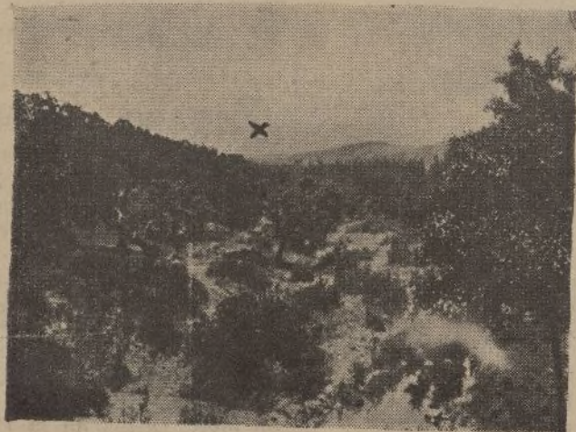
En el lugar señalado con X irá emplazado el pantano La Mezquita.