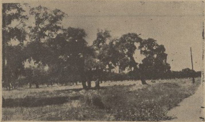
Encinares magníficos que atacados de «lagarta» tienen en la actualidad una ínfima producción y que sus tierras por el contrario producirían espléndidas cosechas regadas por el pantano de la Junta