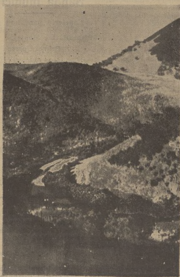
Lugar en que irá emplazada la presa del pantano de La Junta

No nos resta por hoy tiempo ni espacio para extendernos so-