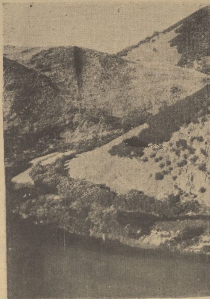
Otra perspectiva del emplazamiento de la «presa» del pantano de La Junta.

Si dentro del plan de obras hidráulicas, elaborado por el Centro de Estudios Hidrográficos continúa barajándose aquellos millones, nada de extraño ni de exorbitante tendría que nuestros diputados, con el exministro, señor Jalón, que ofrecimientos tan favorables en