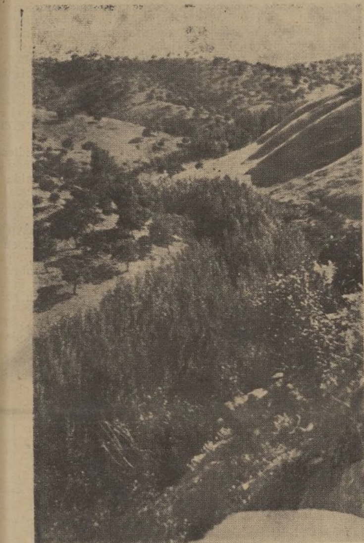
Las márgenes del Murtiga, a todo lo largo de su cauce, están protegidas con frondosa vegetación y extensas alambradas de alambrados.