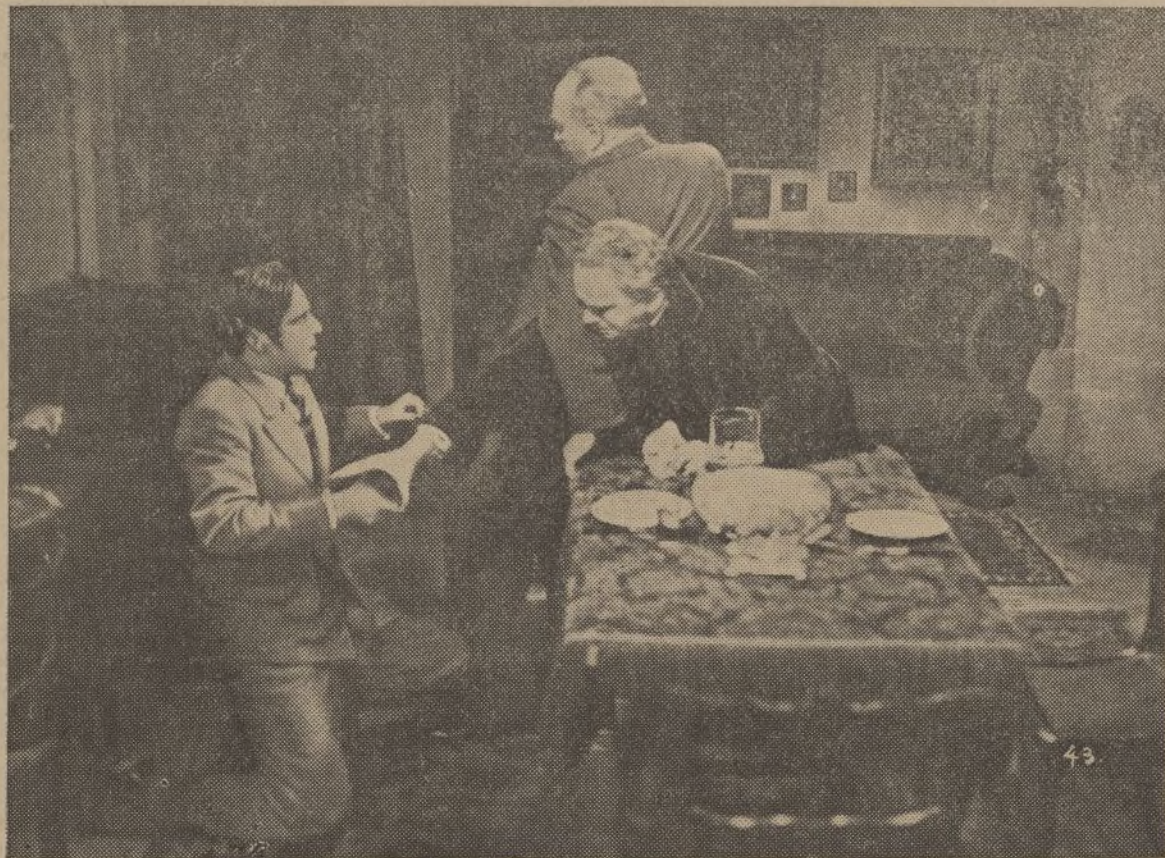
Una escena del emocionante «film» alemán de Cifesa, «LA SANTA Y EL LOCO»

PAPEL DE FUMAR DE TODAS LAS MARCAS Se vende en la Papelería del DIARIO DE HUELVA