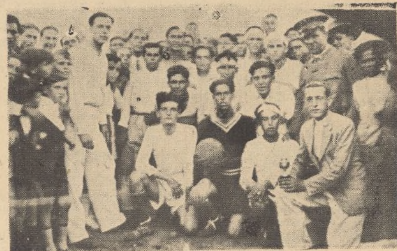
Los equipos de Almonte y Bollullos, exhibiendo la copa del Ayuntamiento, momentos antes de comenzar el segundo tiempo

En el primer día se han realizado ventas de potros a precios regulares las yeguas, cuya excelente presentación ha impresionado satisfactoriamente, ya que podía esperarse que de las marismas peladas saliera un ganado endeble.