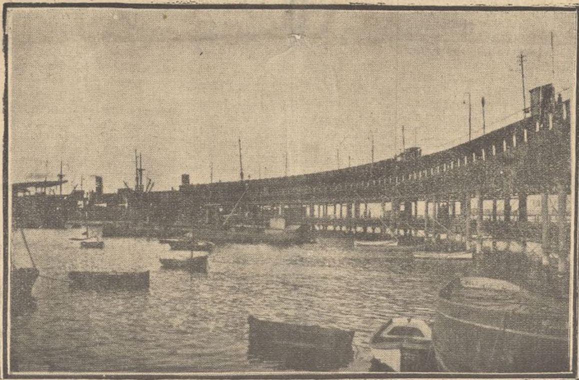
El Magnífico muelle de la Compañía de Río Tinto, obra monumental de hierro que avanza cerca de medio kilóm. tro en nuestra ría.

mo Social, despertará y activará nuestro espíritu comercial; y al hacernos compatibles en el sentido económico, sobrevendrá la explotación directa de los distintos y no pocos productos, que, por esta carencia, exportamos hoy en su estado primitivo. Estas obtenciones, significarán la dinamía o transformación total del sucesivo desenvolvimiento económico de esta provincia, quedando totalmente extinguido su «paro forzoso» y en una marcha de franca progresión, la prosperidad económica social de la misma.