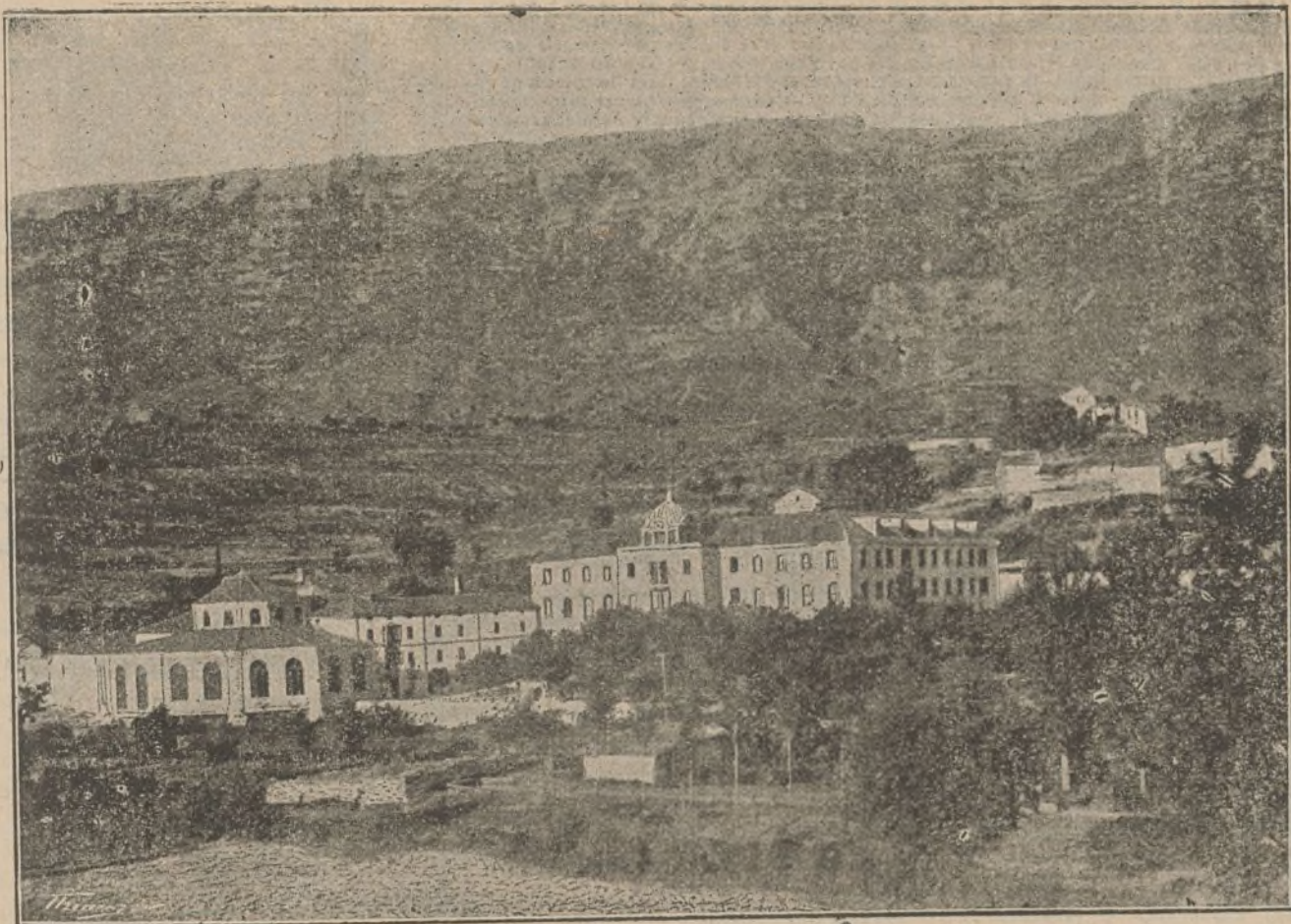
Vista del Balneario de Zuazo (Alava).

El crédito universal que ha alcanzado este importante Establecimiento, es la mejor garantía de las virtudes curativas de estas especiales aguas minerales en todas las enfermedades crónicas del órgano respiratorio , sean ó no diatésicas y cualquiera el lugar de este aparato en que se hallen localizadas. La feliz asociación mineral del sulfuro de sodio al nitrógeno que poseen, llena la doble indicación que el médico se propone en la mayor parte de los enfermos de pecho y garganta que con tanta frecuencia lo necesitan; demostrado palmariamente con los satisfactorios resultados obtenidos en enfermos, y que no consiguieron con ninguna agua mineral dotada tan sólo de uno de estos dos principalísimos factores. La Sociedad propietaria, deseosa de corresponder á la numerosa y selecta concurrencia que acude en busca de su salud, no ha perdonado medio para proporcionarles cuanto aconseja la ciencia médica moderna, montando al efecto un Balneario de nueva planta, dotado de cuanto más útil se conoce en el extranjero para conseguir los mejores resultados. Un millón de pesetas gastado en las nuevas obras demuestran la importancia de las mismas, comprendidas en ellas un suntuoso hotel con fonda de primer orden á la española y francesa para todas las clases de la sociedad; elegantísimo salón de fiestas; café y billares; preciosa Capilla pública; galerías cubiertas para paseo y un gran parque para recreo, iluminándose todos los edificios con profusión de luz eléctrica.