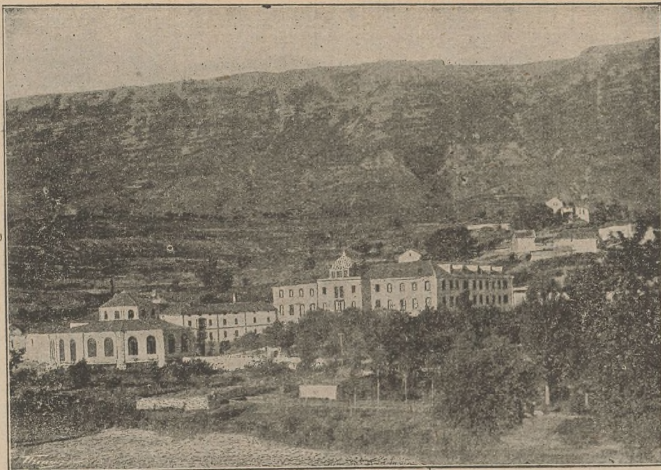
Vista del Balneario de Zuazo (Alava).