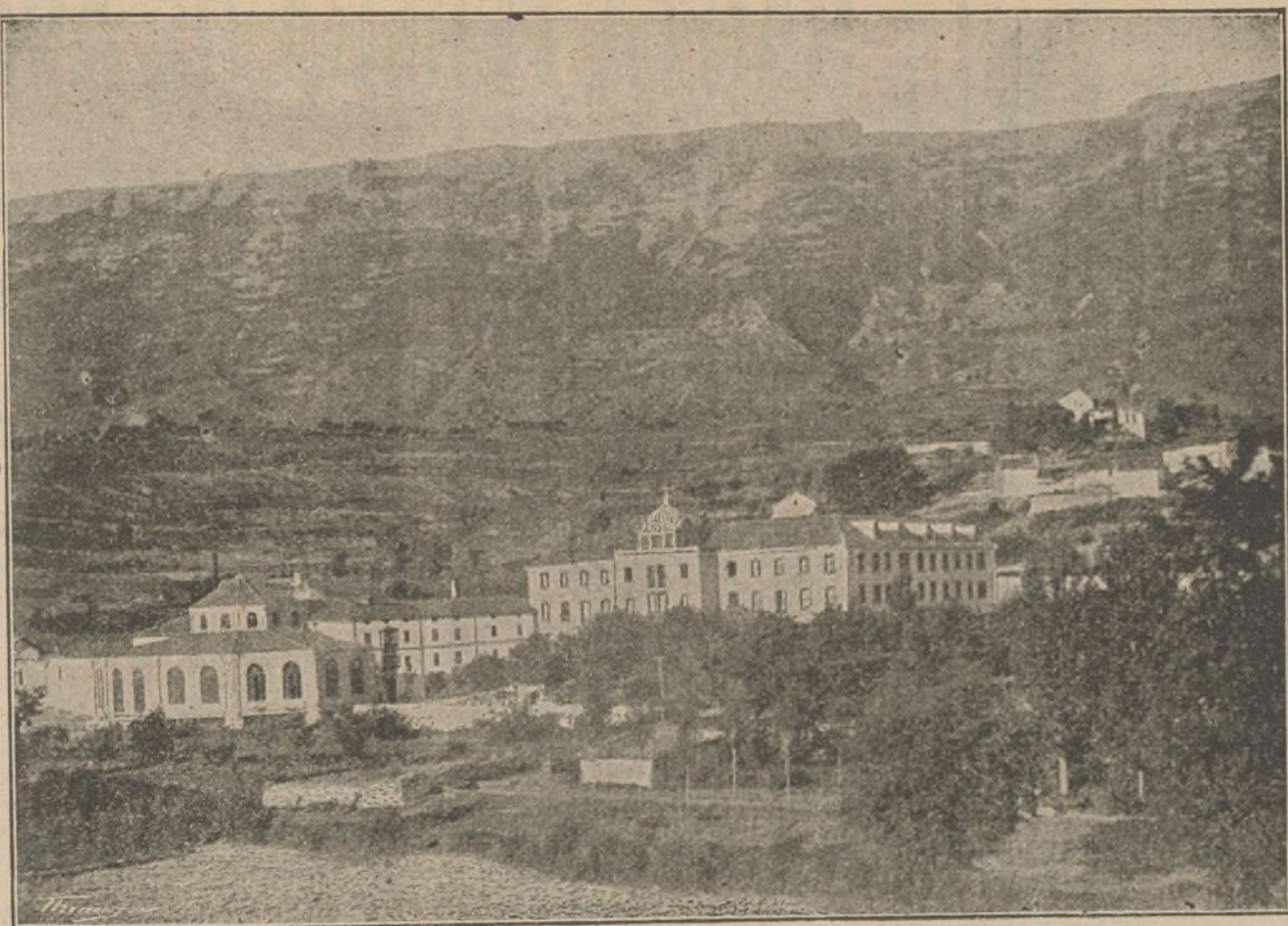
Vista del Balneario de Zuazo (Alava).