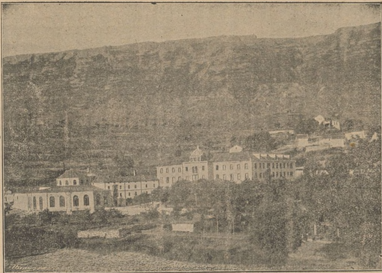
Vista del Balneario de Zuazo (Alava).