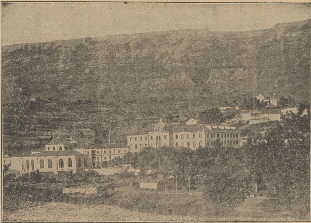
Vista del Balneario de Zuazo (Alava).