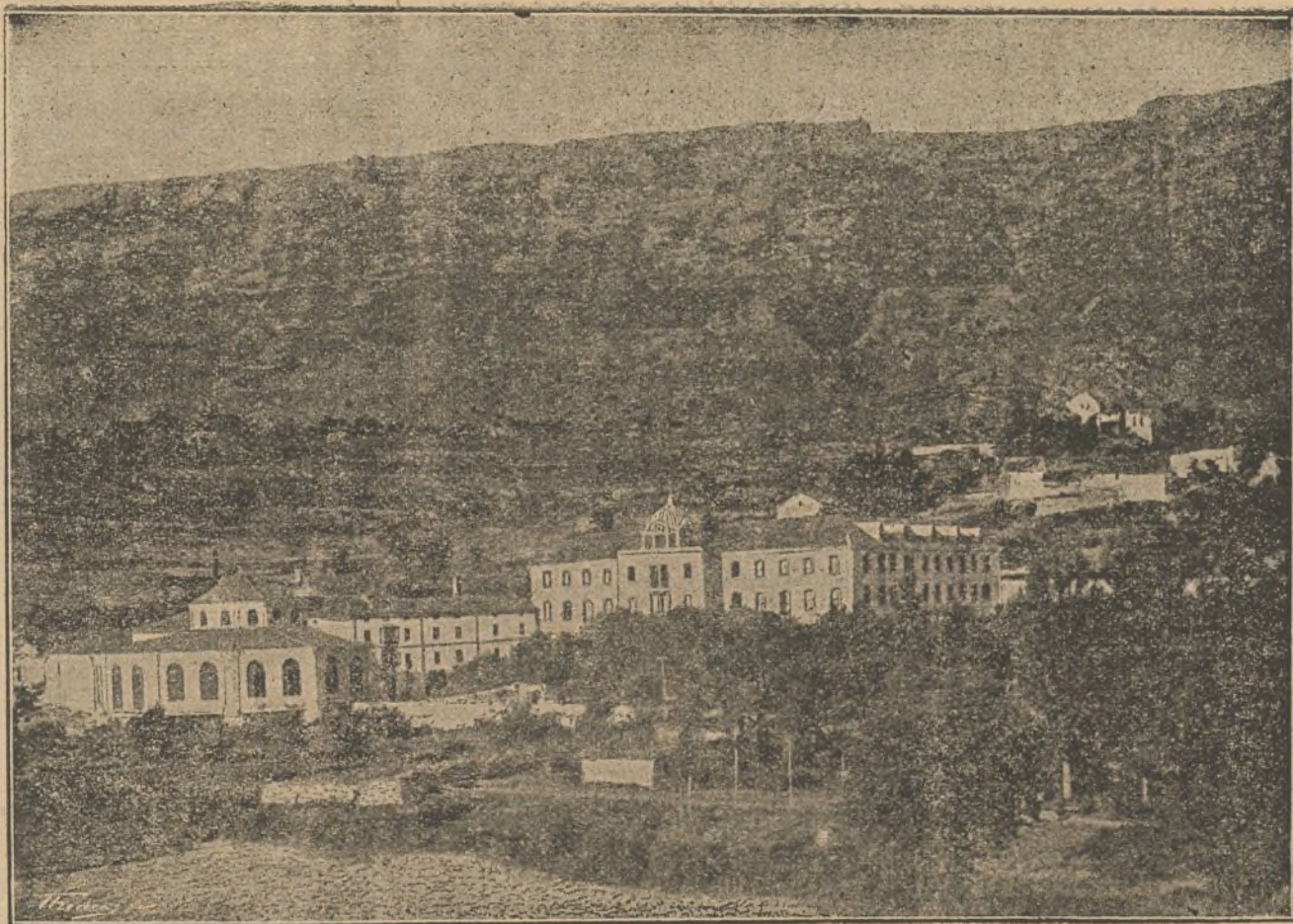
Vista del Balneario de Zuazo (Alava).

Premiadas con cuatro medallas de ORO y tres de PLATA