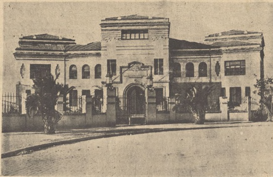
Espléndido edificio de las Escuelas de los Ferroviarios, situado en la carretera de Odíel y que es legítimo orgullo de la Zona 23.