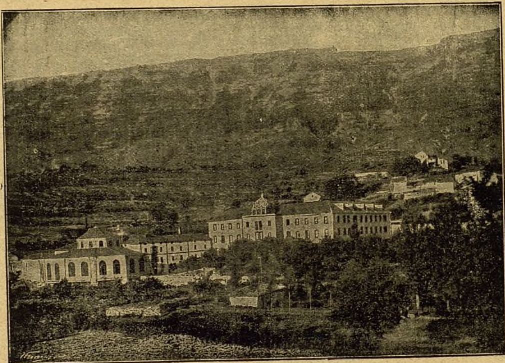
Vista del Balneario de Zuazo (Álava).

El crédito universal que ha alcanzado este importante Establecimiento, es la mejor garantía de las virtudes curativas de estas especiales aguas minerales en todas las enfermedades crónicas del órgano respiratorio , sean ó no diatésicas y cualquiera el lugar de este aparato en que se hallen localizadas. La feliz asociación mineral del sulfuro de sodio al nitrógeno que poseen, llena la doble indicación que el médico se propone en la mayor parte de los enfermos de pecho y garganta que con tanta frecuencia lo necesitan; demostrado palmariamente con los satisfactorios resultados obtenidos en enfermos, y que no consiguieron con ninguna agua mineral dotada tan sólo de uno de estos dos principalísimos factores. La Sociedad propietaria, deseosa de corresponder á la numerosa y selecta concurrencia que acude en busca de su salud, no ha perdonado medio para proporcionarles cuanto aconseja la ciencia médica moderna, montando al efecto un Balneario de nueva planta, dotado de cuanto más útil se conoce en el extranjero para conseguir los mejores resultados. Un millón de pesetas gastado en las nuevas obras demuestran la importancia de las mismas, comprendidas en ellas un suntuoso hotel con fonda de primer orden á la española y francesa para todas las clases de la sociedad; elegantísimo salón de fiestas; café y billares; preciosa Capilla pública; galerías cubiertas para paseo y un gran parque para recreo, iluminándose todos los edificios con profusión de luz eléctrica.