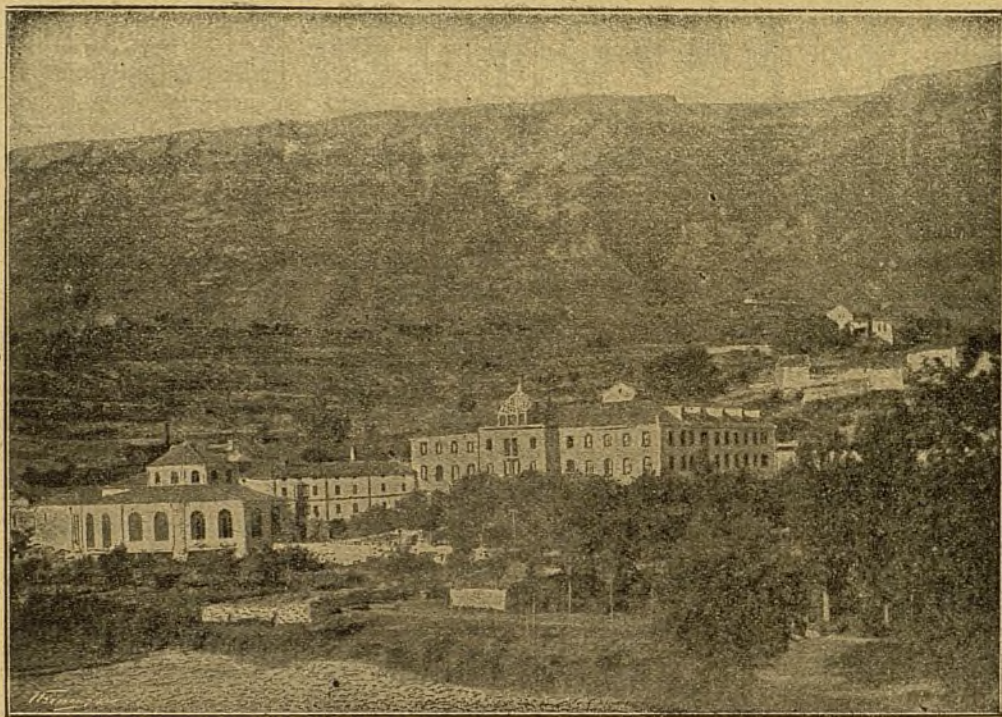
Vista del Balneario de Zuazo (Alava).