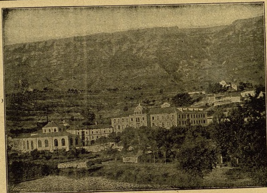
Vista del Balneario de Zuazo (Alava).

El crédito universal que ha alcanzado este importante Establecimiento, es la mejor garantía de las virtudes curativas de estas especiales aguas minerales en todas las enfermedades crónicas del órgano respiratorio , sean ó no diatésicas y cualquiera el lugar de este aparato en que se hallen localizadas. La feliz asociación mineral del sulfuro de sodio al nitrógeno que poseen, llena la doble indicación que el médico se propone en la mayor parte de los enfermos de pecho y garganta que con tanta frecuencia lo necesitan; demostrado palmariamente con los satisfactorios resultados obtenidos en enfermos, y que no consiguieron con ninguna agua mineral dotada tan sólo de uno de estos dos principalísimos factores. La Sociedad propietaria, deseosa de corresponder á la numerosa y selecta concurrencia que acude en busca de su salud, no ha verdo-nado medio para proporcionarles cuanto aconseja la ciencia médica moderna, montando al efecto un Balneario de nueva planta, dotado de cuanto más útil se conoce en el extranjero para conseguir [los mejores resultados. Un millón de pesetas gastado en las nuevas obras demuestran la importancia de las mismas, comprendidas en ellas un suntuoso hotel con fonda de primer orden á la española y francesa para todas las clases de la sociedad; elegantísimo salón de fiestas; café y billares; preciosa Capilla pública; galerías cubiertas para paseo y un gran parque para recreo, iluminándose todos los edificios con profusión de luz eléctrica.