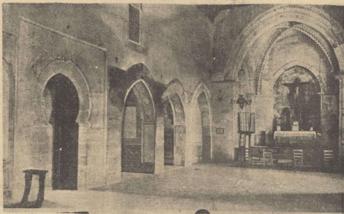
Altar mayor de la pequeña e histórica capilla del inmortal cenobio

sa formal a enviarnos unas cuartillas sobre el interesante tema que anotamos.