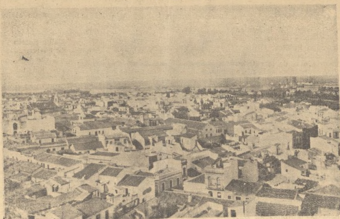
Un aspecto parcial de Huelva a vista de pájaro

dre y después llevársela a una choza formada de tablas y cubierta de hojas de palmera, sujetas con bejucos, especie de enredaderas. La cama matrimonial está formada de cuatro estacas y un encañizado de bambúes, con una cubierta de corteza del árbol llamado Ochro-ma. El ajuar del novio consiste en una acha o machete y el de la novia una olla o vasija de barro cocido. Las mujeres se adornan para el casamiento con collares y pulseras, si pueden ser, de cuentecitas de oro y vayas negras y rojas y adornos de plumas de tucán de cuatro colores.