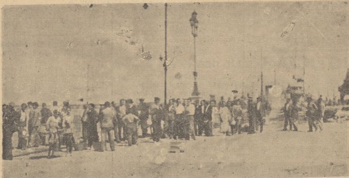
Así aguarda el público, sediento de yodo y de baños, la llegada de las canoas que ha de llevarlo a Punta Umbria.