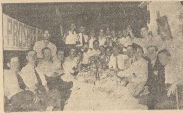
Grupo de concurrentes a la comida organizada por el «Deportivo Prosperidad» en honor de los redactores deportivos.