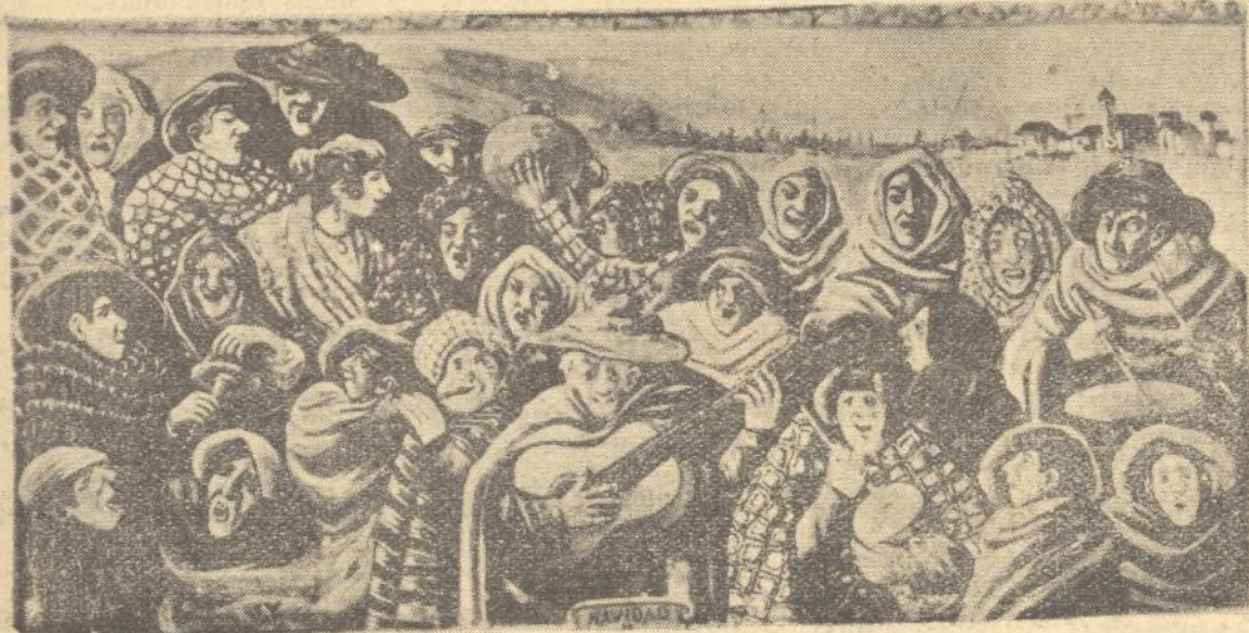
«Navidad en Segovia», uno de los cuadros que figuran en el típico «Mesón del Segoviano», y que, como otros tantos, llama poderosamente la atención por su concepción caprichosa y raro colorido.

Tristán Bernard, volviéndose hacia el amigo que le había acompañado al teatro, le dijo:—A esa mujer le confiaría un secreto.