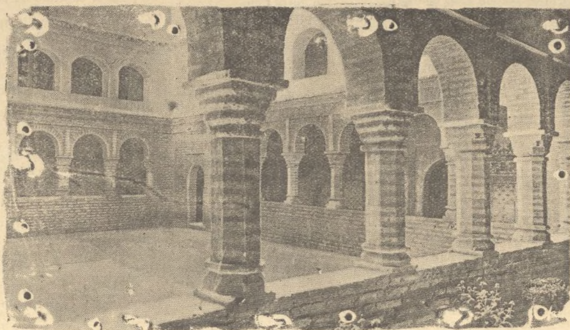
El bellissimo patio mudéjar, escenario insuperable de las grandes solemnidades coloniales.

da una preciosa pintura y barniz. El balso, cuya corteza se emplea para hacer canoas, llamada majagna. El Ochroma, árboles, cuya corteza es tan suave y flexible, que sirve para cubrir la desnudez de los indios. El árbol Milluyo, con bayas de color amarillo, cuya harina usan las mujeres para extraer de ella el almidón.