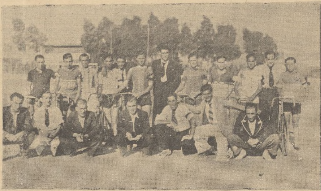
Corredores que tomaron parte en la carrera ciclista celebrada antes del encuentro entre una Selección local y el Onuba F. C. que terminó con la victoria de los Seleccionados, por 4 a 1