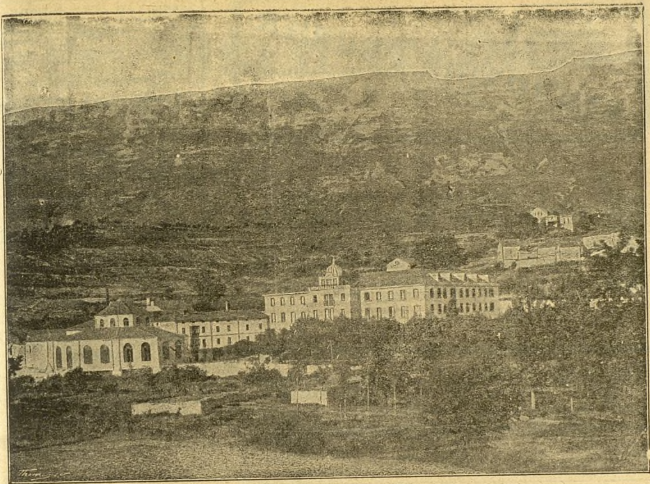
Vista del Balneario de Zuazo (Álava).