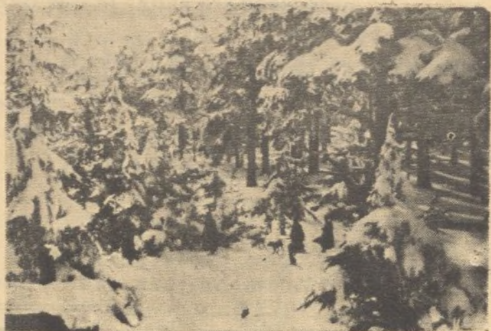
...y allá enfrente, los pinares cubiertos de nieve del monte Tissi-Ifri, verdadero encanto de la Naturaleza