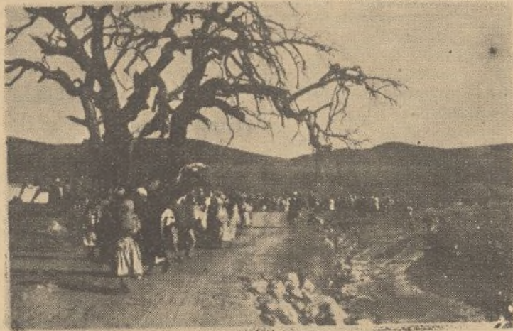
Camino del zoco, donde han de realizar sus mercaderías, marchan confiados e ingenuos indígenas

Ya por aquí, el terreno es más productivo. Después de pasar el poblado de Beni Urraguel, divisamos panoramas y paisajes aun mil veces más pintorescos que los anteriores; es la kábila de Bokoia, sublimidad de lo sublime, cuya belleza en todos sus aspectos, llega a la