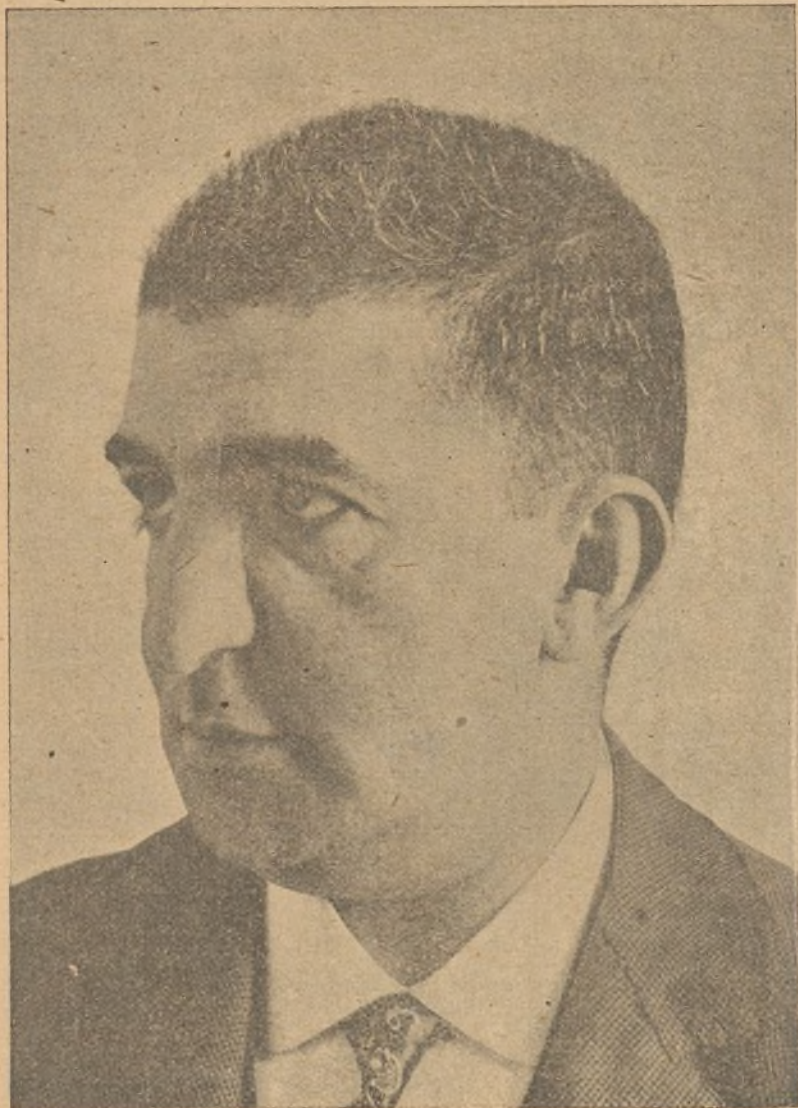
FIG. 7. a —El mismo aspecto, visto de perfil, que el de la fig. 6. a

A pesar de la seguridad diagnóstica clínica, quise