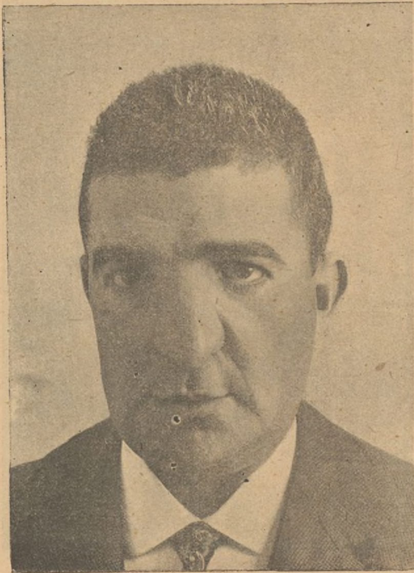
FIG. 6. a —Aspecto del enfermo (visto de frente), quince días después de practicada la última resección del tumor del lado derecho, el día 9 de Mayo último.

A los ocho días desapareció en absoluto la inflamación erisipelatosa; la línea de sutura se hallaba perfectamente cicatrizada, y tan sólo se hacía una cura diaria intranasal. Dos días más tarde salió el enfermo de casa, conjurado y terminado felizmente este peligro de la erisipela, la cual se presentó á pesar de las precauciones tomadas y sin saber realmente todavía cómo y por dónde vino. El contraste que se advertía en la cara del