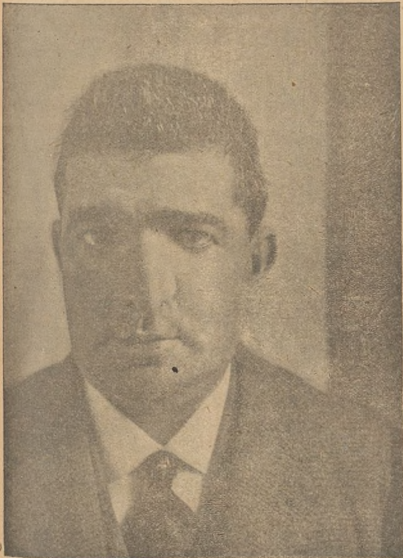
FIG. 4. a — El paciente, visto de frente, después de practicadas las operaciones á través de ambas fosas nasales (en los días 29 de Enero, 7 y 19 de Febrero), y de la resección del tumor del lado izquierdo, practicada el 5 de Marzo.

En este trabajo tuve que resecar por arriba todo lo que fué apófisis ascendente del maxilar superior y borde postero-externo del propio nasal, porción infero-interna de la órbita, en una extensión próximamente de medio centímetro ó más, cuerpo del maxilar en la porción correspondiente al seno, que no existía por hallarse invadido por el osteoma, y un trozo del ángulo y borde antero-inferior del hueso malar.