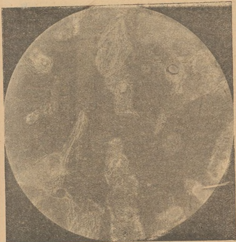
FIG. 8. a —Micro-fotografía de una preparación histológica del osteoma, hecha por el Dr. Ramón y Cajal.

un desarrollo comparativamente menor que el operado por mí.