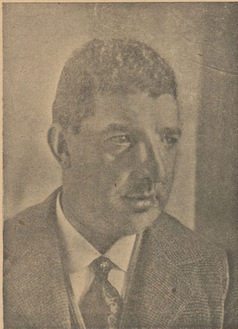
FIG. 5. a — Perfil del mismo, para mejor compararlo con el lado no operado.

El enfermo reaccionó bien. A las veinticuatro horas se levantó el apósito, encontrando ya toda la superficie externa en franca cicatrización. Extraídas las tiras de gasa colocadas en el interior de la fosa nasal, procedí á un enérgico lavado con agua hervida y formalina, se-