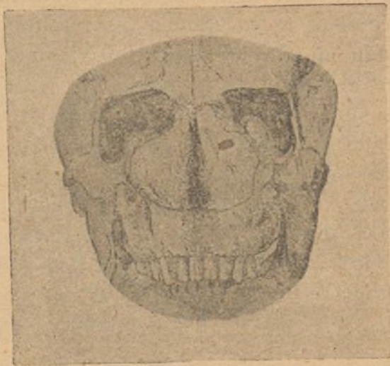
FIG. 9. a —Osteo-fotografía de lo que debió ser la tumoración ebúrneas.

De la importancia en extensión y profundidad del que es objeto del presente trabajo, sólo registra uno la ciencia quirúrgica, y ese no fué operado. Me refiero á la calavera existente en el Museo Dupuytren, regalada por el Dr. Cruveilhier, la cual ostenta múltiples osteomas ebúrneos simétricos, diseminados por los parietales, maxilares superiores, maxilar inferior, etc., y cuya figura puede verse en la página 489 del tomo II de la edición española de la Patología quirúrgica de Nelaton.