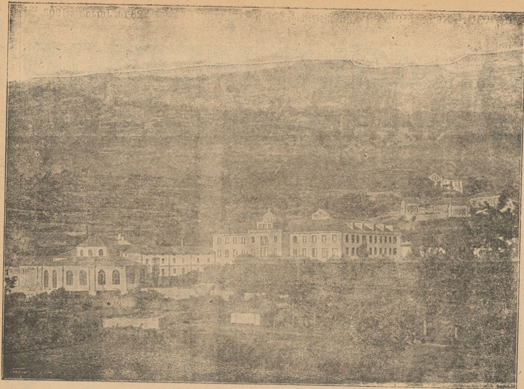
Vista del Balneario de Zuazo (Álava).