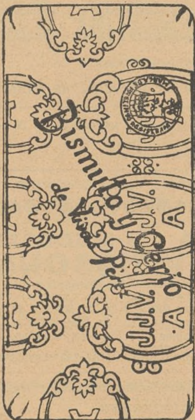
Dibujo de la caja de papeles

Dibujo de los nuevos envases de papeles y de pastillas comprimidas para los SALICILATOS DE BISMUTO Y CERIO que VIVAS PÉREZ se ha visto en la necesidad de adoptar para evitar se sorprenda al público con infames falsificaciones y groseras imitaciones, que con locura han hecho infinidad de.... industriales. Exija estos envases todo el que tenga que emplear los SALICILATOS