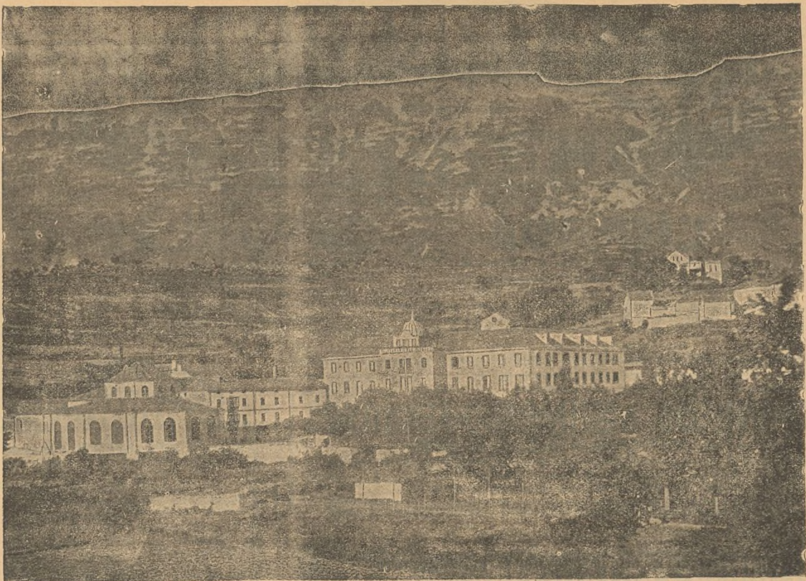
Vista del Balneario de Zuazo (Álava).