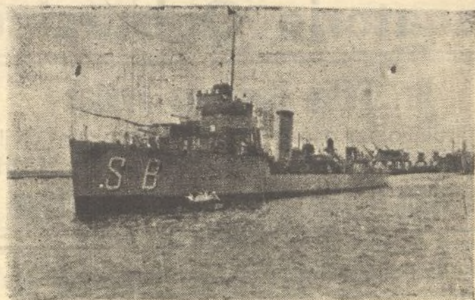
El destructor «Sánchez Barcaytegui», mide 101'60 metros y desplaza 2.110 toneladas.