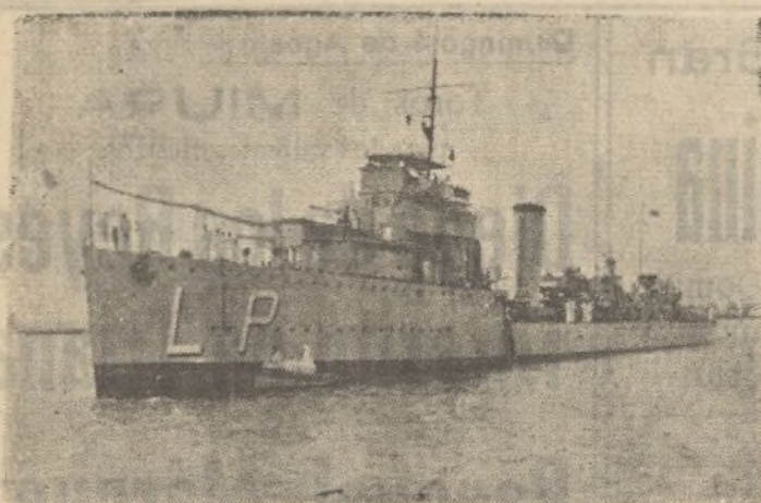
Destrucción «Lepanto», buque rapidísimo de nuestra marina, que tiene las mismas características que sus restantes compañeros.

Redacción y Administración: Gravina n.º 4 - Apartado n.º 49 Tel. 1324 - Franqueo concertado No se devuelven los originales