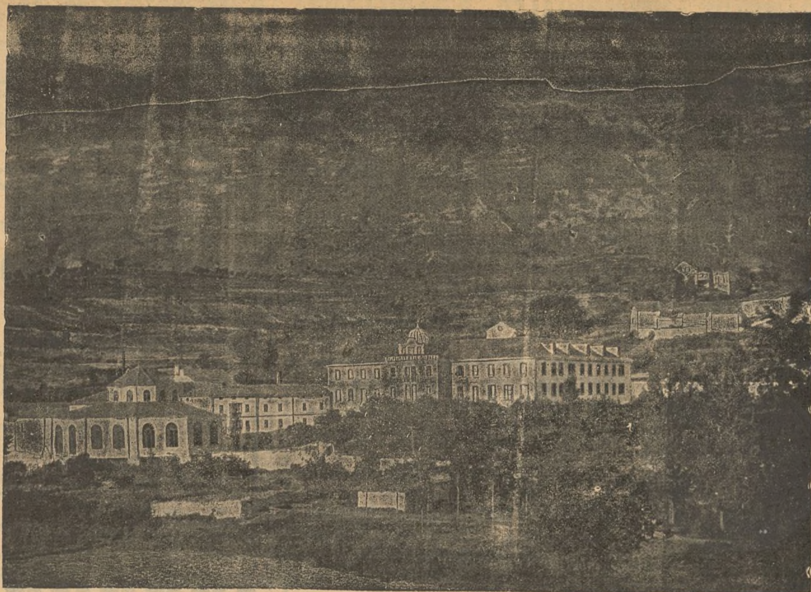
Vista del Balneario de Zuazo (Álava).