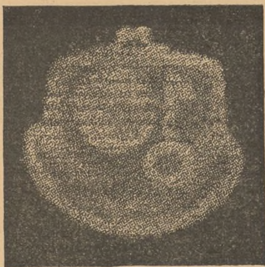
FIGURA 1. a

Los rayos de radium provocan fluorescencia, aunque más débil que la de los rayos Röntgen, y también actúan sobre la placa fotográfica á través del papel, de la madera y de láminas metálicas delgadas; la penetración en muchos cuerpos no es tan grande como la de los rayos Röntgen: carne y huesos, por ejemplo, se dejan atravesar con mucha más dificultad por los rayos Becquerel, de tal manera, que es imposible recoger la imagen de los huesos de la mano. En la fig. 1. a está la imagen de un portamonedas con una moneda y una llave; fotografía hecha por M me . Curie. La claridad de esta imagen no es comparable con la que dan los rayos Röntgen.