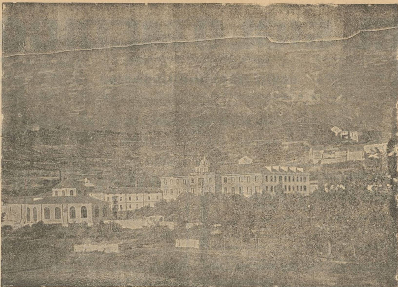
Vista del Balneario de Zuazo (Alava).