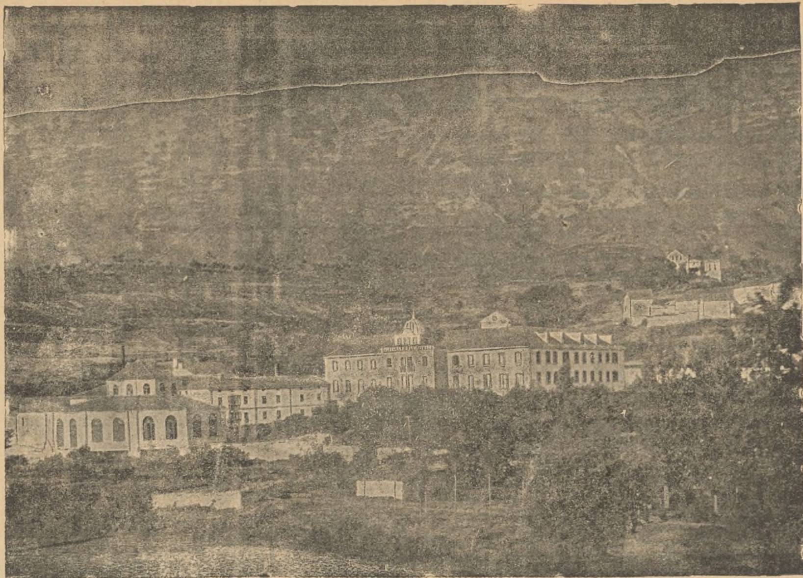
Vista del Balneario de Zuazo (Alava).