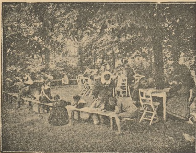
Colonia escolar para niños enfermos.

En el laboratorio químico, los análisis pasan de 30.000. ¿Será necesaria una buena organización?