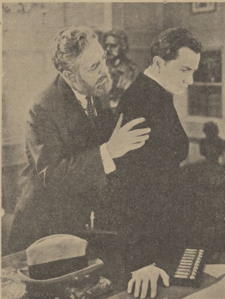
Una escena de «Lo que los dioses destruyen», película Columbia que distribuye la marca española CIFESA

El cineclub español no es aún ese cerebro orientador que el cinema necesita, ya que para llegar a serlo haría falta una potente Federación de Cineclubs y un mayor número de centros similares distribuidos en todas las regiones. Solo de este modo, el cine dejaría de ser un cuerpo multiforme, grande, pero sin cabeza. No obstante, los cineclubs españoles, sin distinción de tendencias y unificados por una misma misión artística han realizado calladamente, sin prisas una ardua labor de captación de elementos de valía y han formado un público inteligente, ansioso por visionar obras de avanzada que huyan de esa superficialidad que hoy acapara todo el cinema, que es, al fin, el objetivo principal de todo cineclub: la educación artística en el cinema.