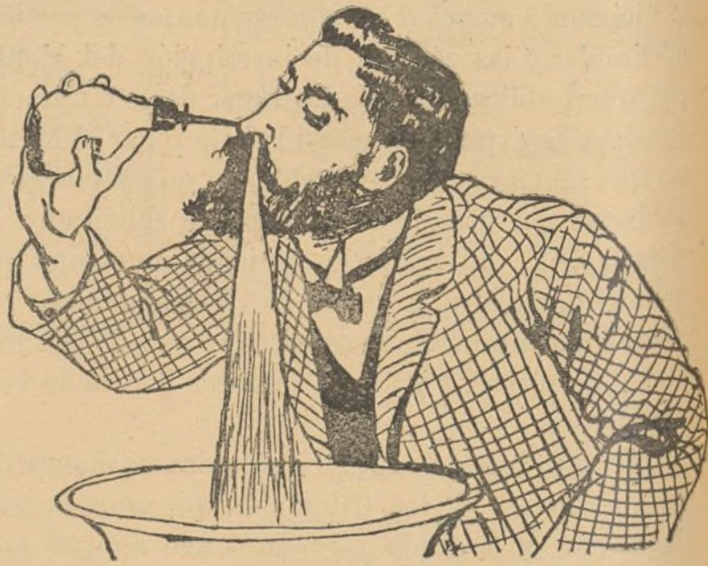
Figura 3. a

También puede usarse para las irrigaciones una pera ordinaria, siguiendo las prescripciones recomendadas y colocándose el enfermo según indica la figura 3. a .