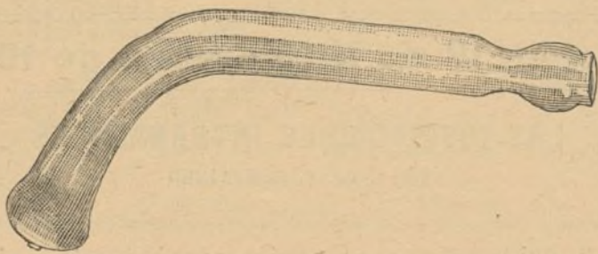
Figura 2. a

La extremidad libre del tubo llevará colocada una cánula nasal acodada, de cristal, llamada cánula Compairé, como la representada en la figura 2. a , que se encuentra en cualquiera de las casas que venden instrumentos de cirugía.