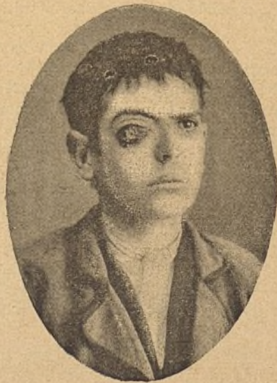
Figura núm. 4.

El tratamiento ortopédico del estrabismo lo tenemos casi abandonado, no por nosotros, sino por el público que no tiene aquella paciencia que hace falta.