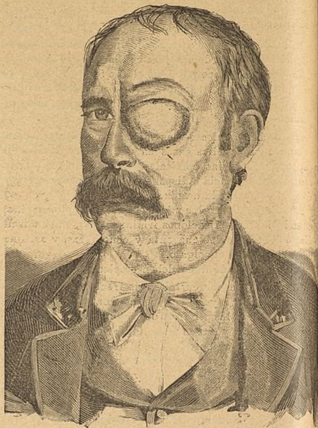
Figura núm. 3.

ción que merece nuestra predilección; así que la empleamos con bastante frecuencia en nuestra práctica.