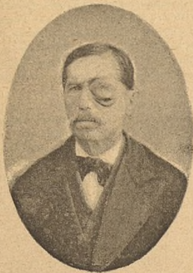
Figura núm. 6.

Otro caso igual al anterior, joven de quince años ( figura núm. 4 ), nos dió ocasión, por su rareza, de ex-