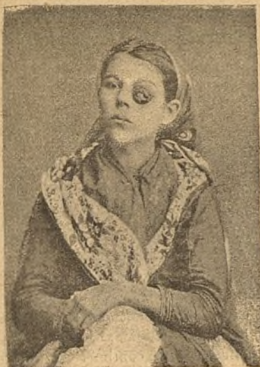
Figura núm. 5.

publicamos en el primer número de nuestro periódico La Oftalmología Práctica . Se trata, pues, de un quiste hidatídico intraocular, diagnosticado por algunos cirujanos de sarcoma y por nosotros de quiste ( fig. núm. 3 ). El enfermo fué operado con feliz éxito por el Dr. We-