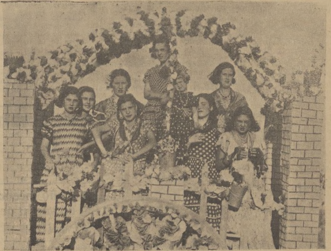
Una de las carretas adornadas que más poderosamente llamaron la atención en la Romería de Clarines. Flores, muchas flores y más caras bonitas a pesar de ese gesto serio con que se nos presentan como si desafiando estuvieran al más exigente: ¿Pero las hay más guapas que nosotras, «so esaborio»?