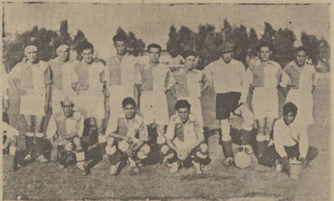
Equipo del Club Deportivo Prosperidad, que venció el domingo en el campo del Velódromo al «Merced F. C.», por 3-1

Ya de noche, regresó el gobernador a Huelva muy satisfecho de las atenciones que con él se habían tenido tanto en Aracena como en Santa Olalla.