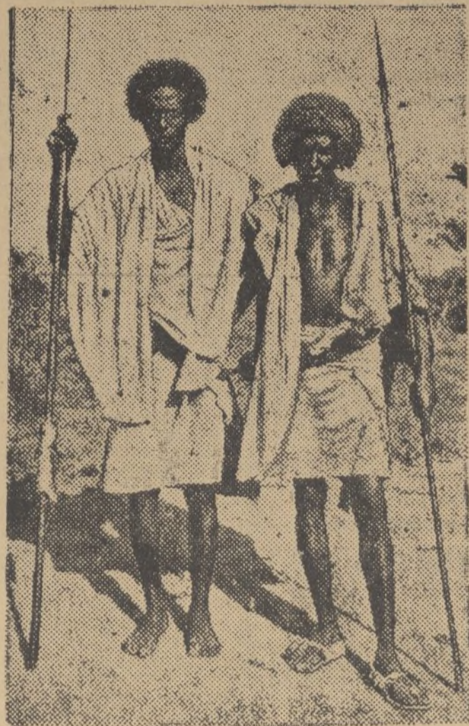
Dos tipos de guerreros de Dukala (Abisinia).

Son hábiles en las guerrillas y diestros en el manejo de la lanza, aunque conocen perfectamente las manipulaciones del fusil.