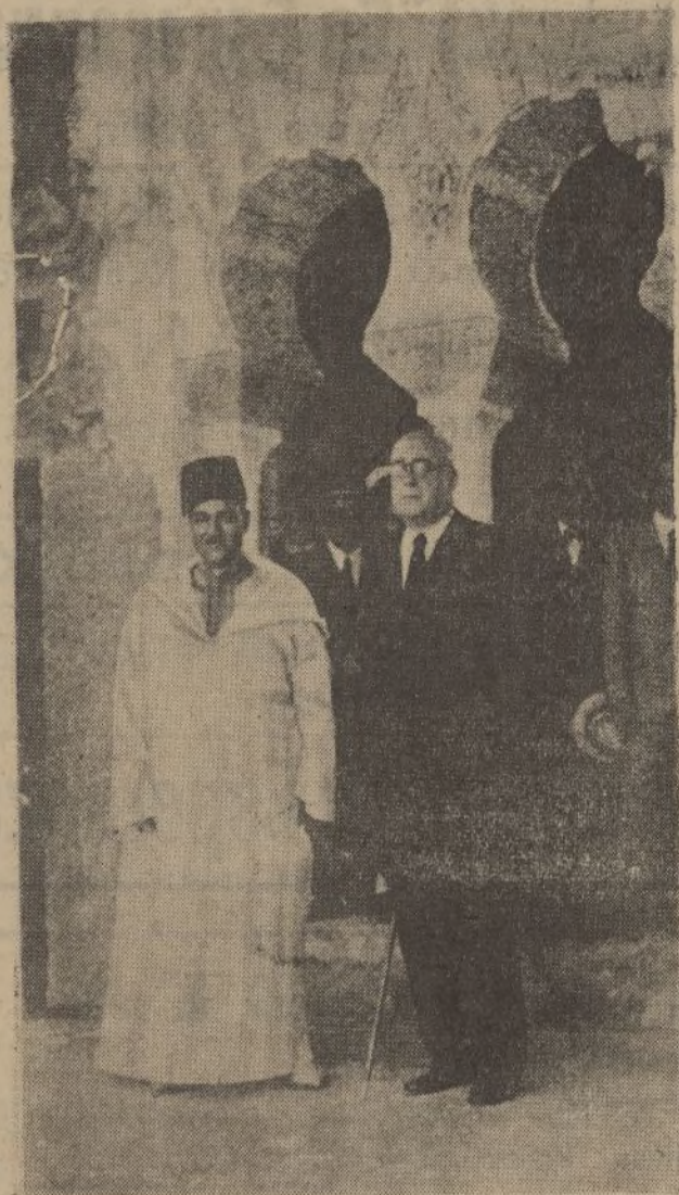
Su alteza imperial el Jalifa de la zona española en Marruecos ha llegado a Málaga, cuyos monumentos importantes ha recorrido. El ilustre visitante en la mezquita de la Alcazaba.