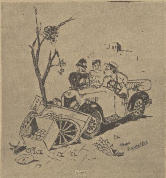
El guardia (con coraje).—¿Cómo se llama? El automovilista.—Prudente.