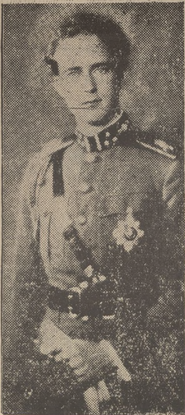
El Rey Leopoldo, de Bélgica, que conducía el «auto» en el momento de producirse el accidente que costó la vida a la Reina Astrid.